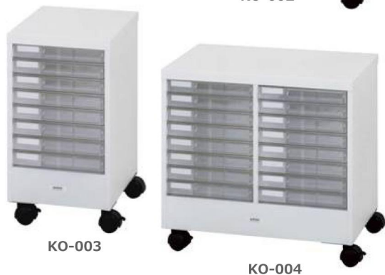
カウンターワゴン A4 浅型