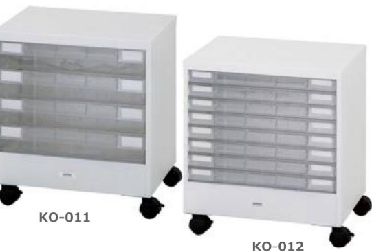
カウンターワゴン A3 深型/浅型