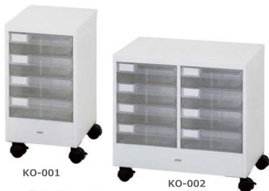
カウンターワゴン A4 深型