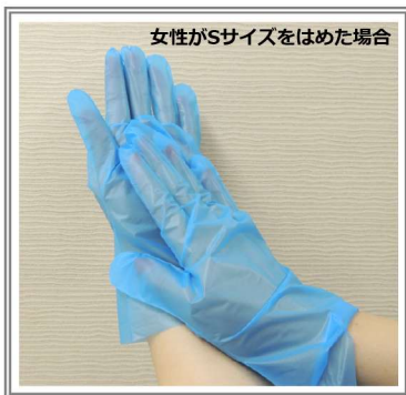
女性がSサイズをはめた場合