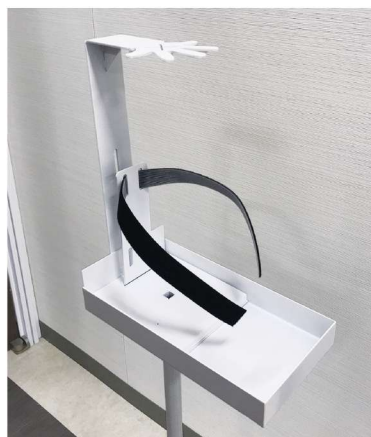
伸縮するマジックテープでボトルを固定できます。