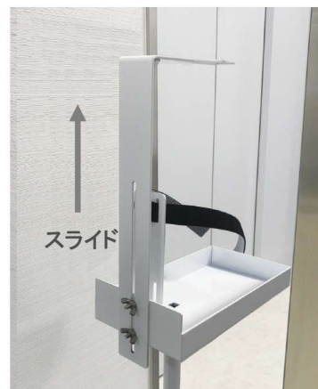
ボトルの高さに合わせる事ができる、スライド機能付。