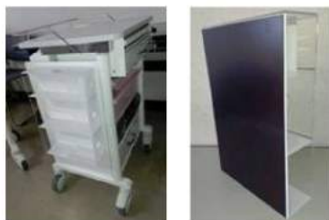
＜背面マグネット仕様＞ カートの側面に取付けました。