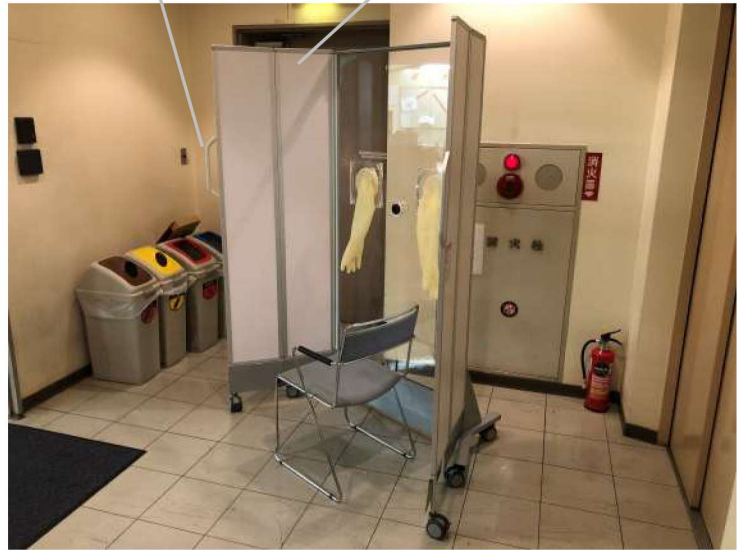
クリップハンドル