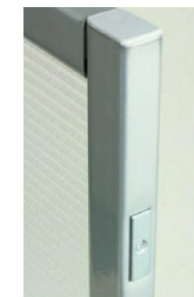
マグネット式連結