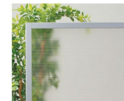
クリアフロスト イメージ