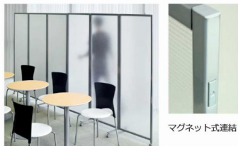
マグネット式連結

クリアフロスト：ポリカーボネイト ガラスに等しい透過性。光の透過性は80~95% 耐衝撃性、耐熱性に優れています。