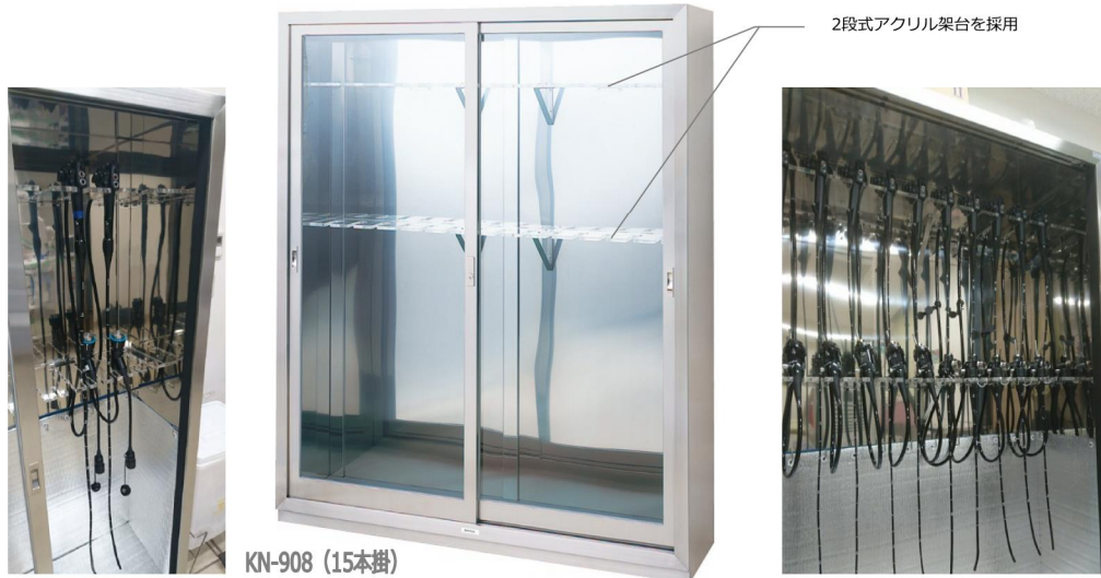
2段式アクリル架台を採用

ケルンオリジナルの2段架台で、各メーカーの主要なファイバースコープを しっかりホールドします。