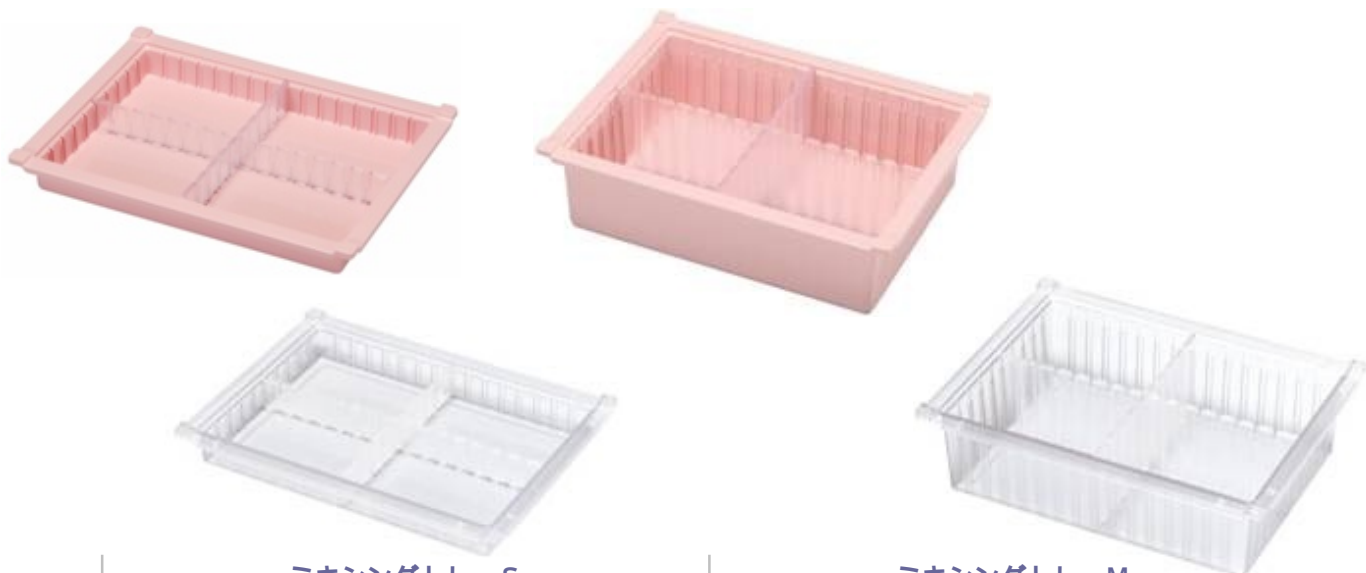
ミキシングトレー S