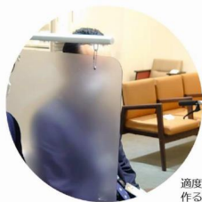
適度なプライバシー空間を作る半透明なクリアパネル

患者さんが安心して来院できる待合環境がより求められてきております。 後付けで設置できる座席間パーテーションは、採光は確保しつつも半透明でプライバシーにも配慮しており、密接を避け、飛沫拡散を防止し、アルコールや次亜塩素酸での清拭が可能です。