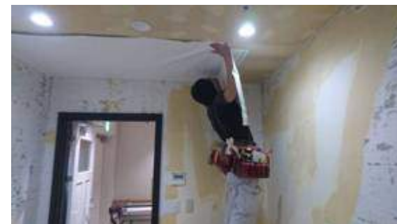
新しいクロスの貼り換え