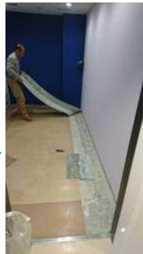
既存の床のシート 剥し作業