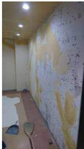
既存の壁のクロス 剥し作業