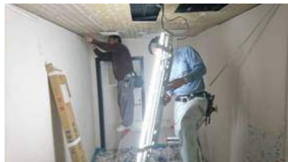
既存照明器具の取り外し