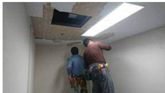
既存ボードの取り外し