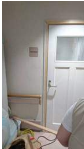
鉄枠を覆うように全体に木枠を追加