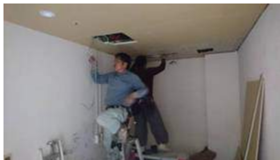
新しいボードの取り付け完了