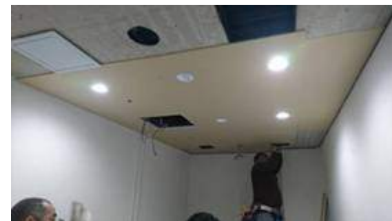
新しい照明器具の取り付け