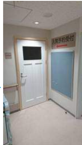
木(デザイン)扉の取付け