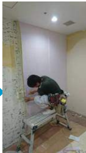
新しいクロス貼り作業