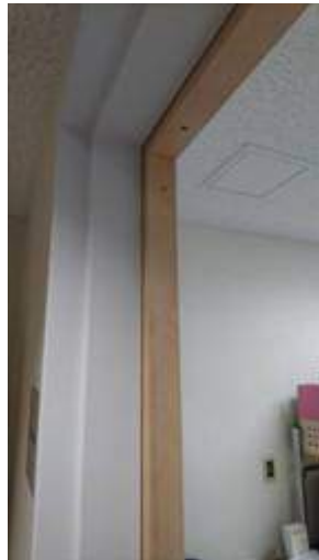
鉄枠の内側に元となる木枠の取付け